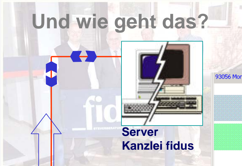
Server Kanzlei fidus