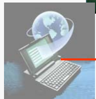
Lokaler Arbeitsplatz beim Mandanten

93056 Monatsplanung [Stichtag 30.09.2007]