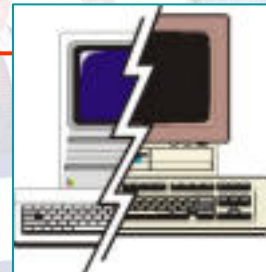
Server Kanzlei fidus